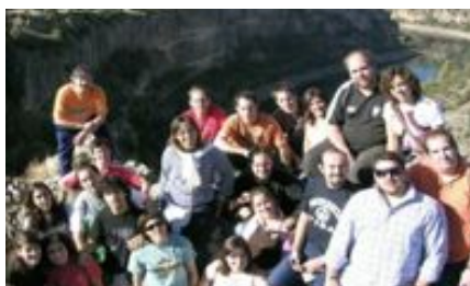
6.- JÓV. ADULTOS MEN