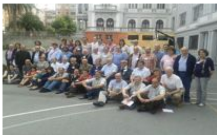
4.- LA COMUNIDAD