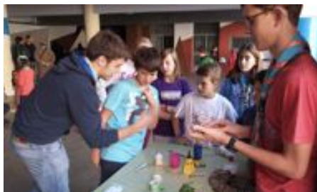
2. PASTORAL VOCACIONAL