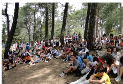
5.- FAMILIA MEN.