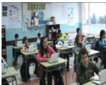
1.- MISIÓN EDUCATIVA

→ retomando todo lo trabajado hasta ahora